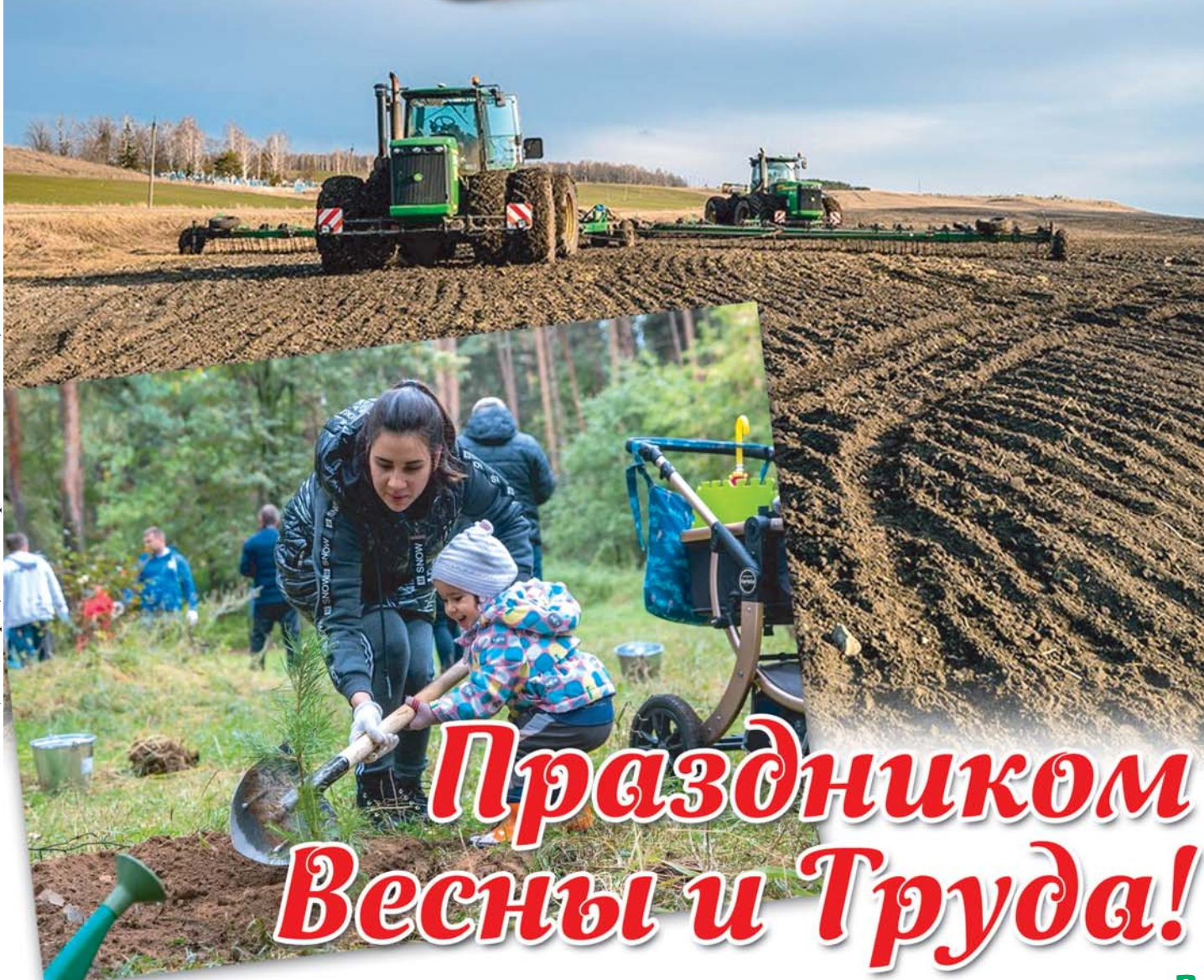
Фотоколлаж А. ТЮРИНОЙ (иллюстрации из открытых источников)