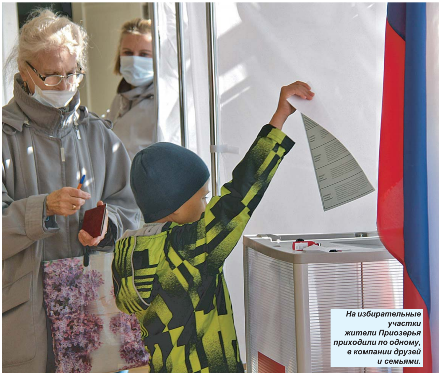
Фото Т. ВАЙНИК

Пресс-служба губернатора и правительства ЛО